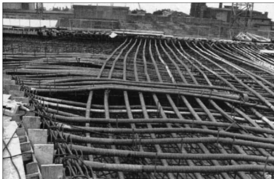
Spannbetonbrücke im Bau: Stahlseile in Hüllrohren verpreßt

hörde der Hansestadt für das laufende Jahr rund 43 Millionen Mark angesetzt. Bewilligt wurden aber nur 23 Millionen. „Der Fehlbetrag“, sagt Vielhaber von der BAM, „wird nach vorne rausgeschoben. Den müssen unsere Kinder bezahlen.“ Das Aufwand-Schubverfahren wird schon seit vielen Jahren angewendet. In Hamburg summiert sich der Fehlbetrag zwischen Soll und Ist mittlerweile auf 180 Millionen Mark.