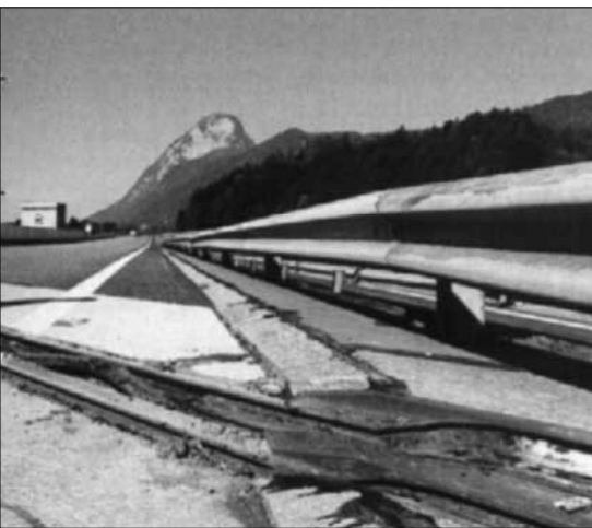
Schaden entsteht bei der Bauausführung“

genüber herkömmlichen Stahlkonstruktionen waren die Brücken aus Spannbeton um etwa 40 Prozent billiger. Und im Vergleich zu den klobigen Stahlbetonbrücken, deren Fahrbahnbeton mit Drahtmatten gefestigt wurde (Fachjargon: „schlafte Bewehrung“), erlaubte die neue Technik ästhetisch schöne Brückenschläge großer Spannweiten.