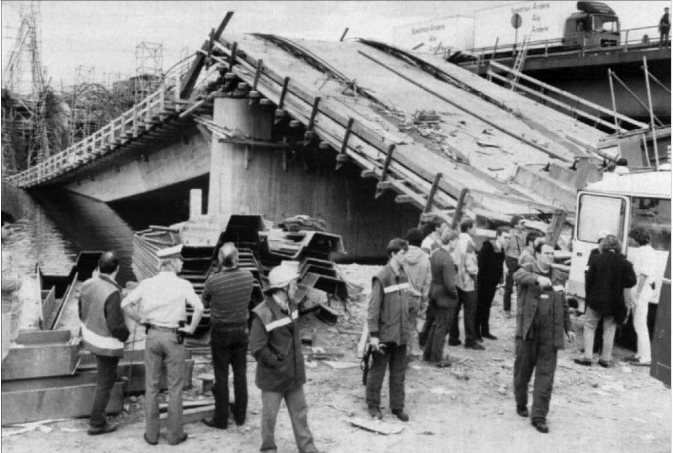
Eingestürzte Autobahnbrücke bei Aschaffenburg: „Baun ’mer mal, dann schau ’mer mal“