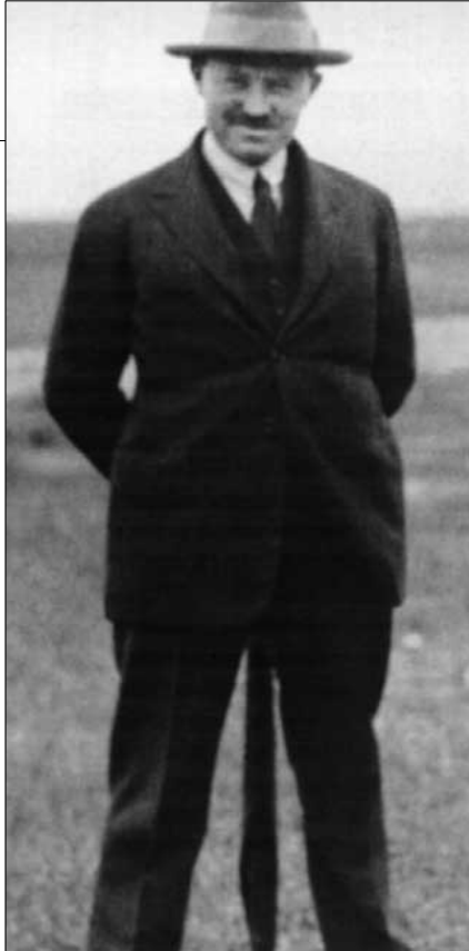
Spannbetonbauer Freyssinet (1923) Auf Sicherheit bedacht

Zur Erhaltung der 1000 kommunalen Brücken in Hamburg hatte die Baube-